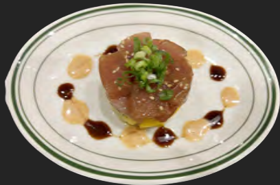
アヒポケタルタル …¥1100