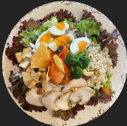
チキンサラダミール ...¥1,400

銀鮭・海老・房州ひじき・とびっこ・キノア・マッシュルーム ミックスビーンズ・ヤングコーン・オニオン・サツマ芋 手作りカッテージチーズ・レタス