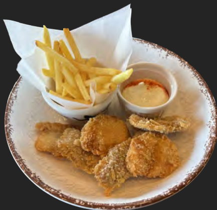
フィッシュ&チップス ...¥800 fish & chips イギリスを代表する国民料理 自身魚のフライとポテトの組み合わせタルタルソースorレモンで