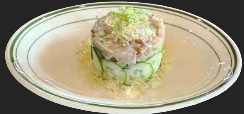
なめろうタルタル …¥1000

ハワイの伝統料理『アヒポケ(マグロの醤油和え)』にアボカドとマンゴーをタルタル仕立てに