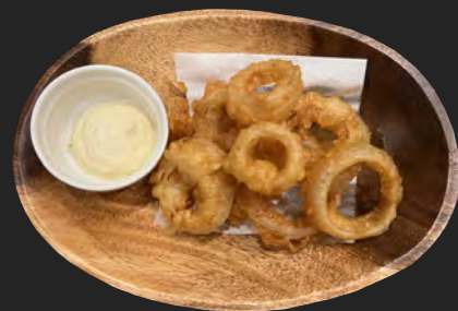
オニオンリングフライ ...¥700 onion rings