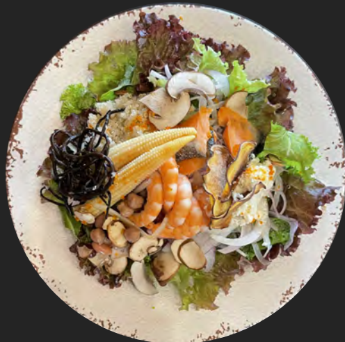
銀鮭と海老のサラダミール ...¥1,600