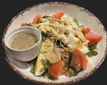
シーザーサラダ caesar salad ...¥980

ベーコン・ゆで卵・ヤングコーン・トマト・フライドオニオン トルティーヤチップス・粉チーズ・レタス・オニオン