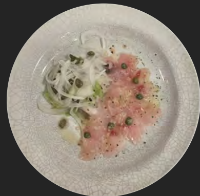
白身魚のカルパッチョ …¥800