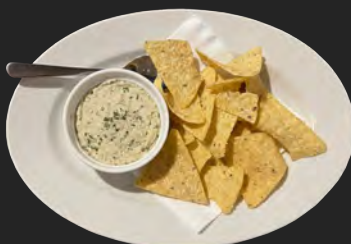
クラムディップ clam dip ...¥600 アサリとサワークリームチーズのディップをトルティーヤチップスにのせて