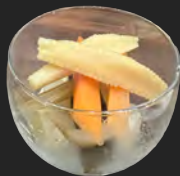
野菜ピクルス ...¥500 pickled vegetables