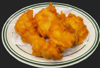
チキンナゲット ...¥700 chicken nuggets ハニーマスタードソースとケチャップ