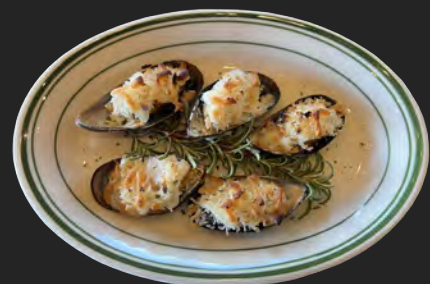
ムール貝のオーブン焼き …¥600