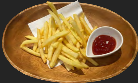
フライドポテト ...¥500 french fries