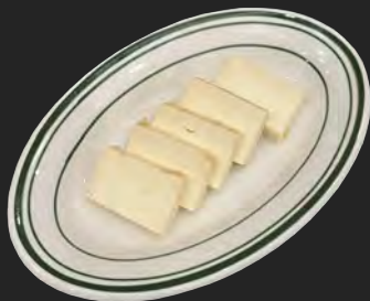
チーズの味噌漬け ...¥500 miso-aged cheese