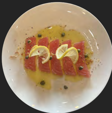
マグロのカルパッチョ …¥900