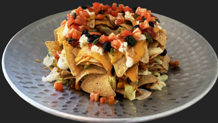
パーティーナチョス (8~10人) ...¥4,800 party size nachos (serves 8-10)