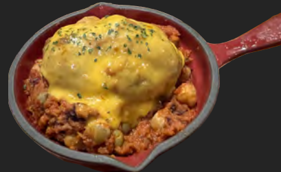
チリコンカンポテト ...¥900 chili con carne potato メキシコ風アメリカ料理のチリコンカンをホクホクポテトとチェダーチーズがとろり