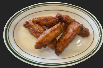
BBQチキン ...¥700 BBQ chicken 手羽中をカラッと揚げてピリッと辛いBBQソースでからめました