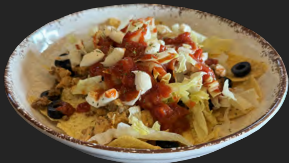
レギュラーナチョス (2~3人) ...¥1,600 regular size nachos (serves 2-3)

カバーナに来たらまずは'ナチョス'から。みんなでワイワイつまめる具たくさんナチョス