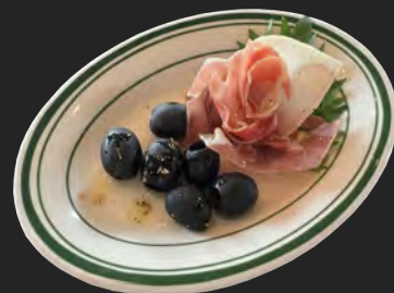
生ハムオリーブ ...¥600 prosciutto & olives